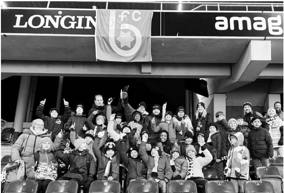
Die Ea- und Eb-Junioren am YB-Sion-Spiel im Wankdorf...