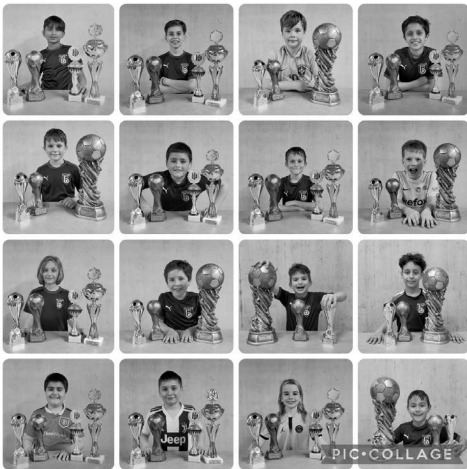
Die Junioren präsentieren stolz ihre gewonnenen Pokale.